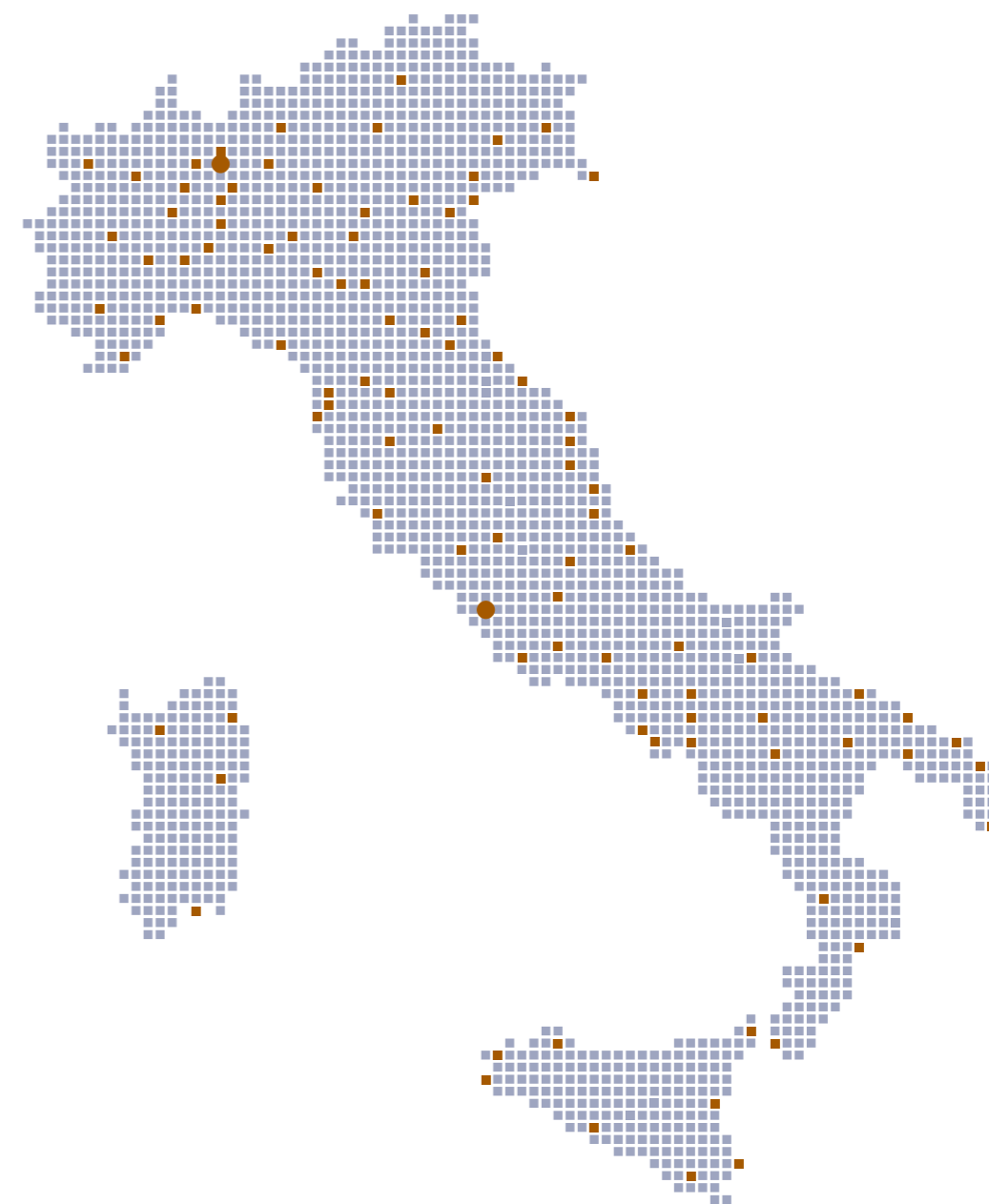
SEDI D'ESAME IN TUTTA ITALIA

Fanno parte delle strutture didattiche anche i locali destinati al "Centro Ricerche sull'Apprendimento", al "Centro servizi e-learning" e ai gruppi redazionali che si occupano del materiale didattico.